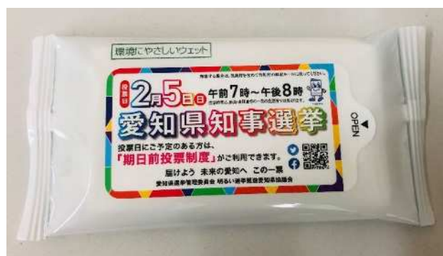
2 ウェットティッシュ (W200×H150mm)