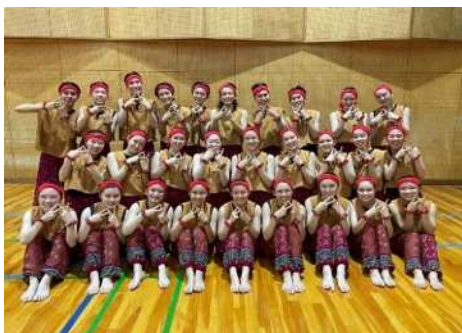
＜県立昭和高等学校ダンス部の皆様＞