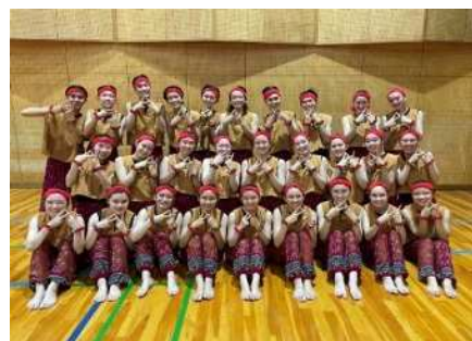
<県立昭和高等学校 ダンス部>

若い世代を投票へと動かすため、数々の全国大会に出場している強豪校である県立昭和高等学校ダンス部がダンスパフォーマンスを披露します。最近の選挙では10代・20代の有権者の投票率が低いことが課題となっている中、熱い思いとクオリティの高いパフォーマンスにより若い世代へ投票を力強く呼び掛けます。