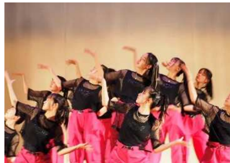
＜ダンスパフォーマンス風景＞