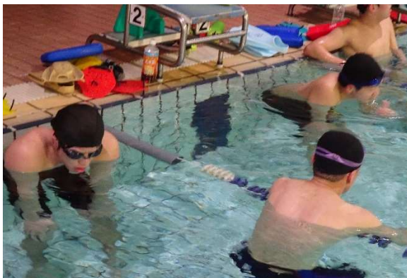
インターバル間の休憩の様子