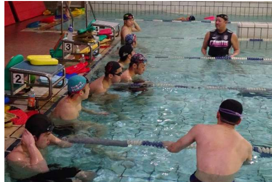
指導者の話を聞くアカデミー生たち