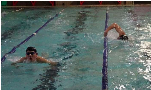
アカデミー生の泳ぎ

障がい者水泳に関する専門的な指導を受けられる環境で、競技レベルの高い選手たちと一緒に質の高いトレーニングを行いました。