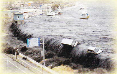
岩手日報2011年3月13日付