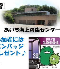
あいち海上の森センター

○参加方法 愛環山口駅の改札付近でルートマップを受け取りウォーキングを開始してください！