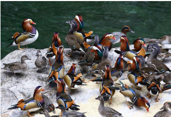
「おしくらまんじゅう」