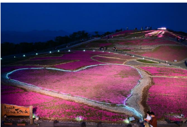
「ライトアップ芝桜」