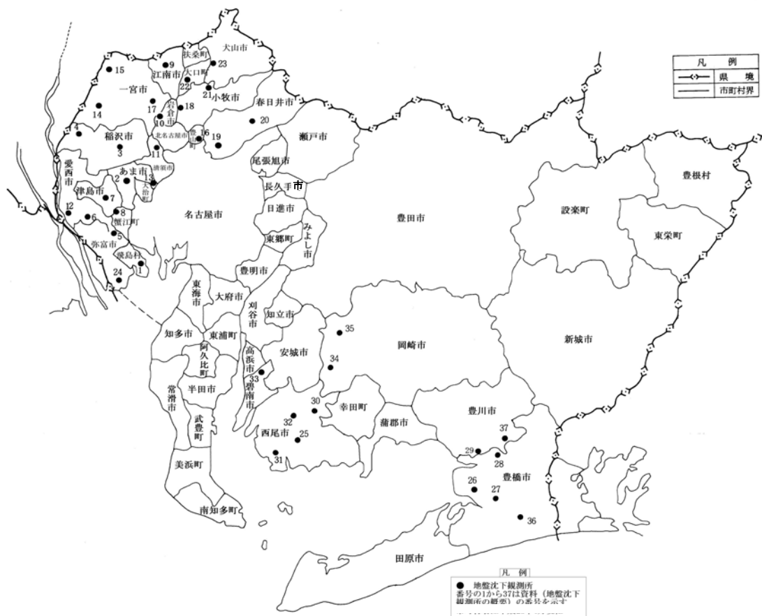
資料-3 (1) 地盤沈下観測所の設置状況図