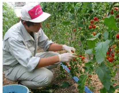
<ミニトマトの収穫実習>

野菜、草花、果樹、作物、緑化植物などの栽培や、家畜の飼育に関する知識や技術を身に付け、将来の経営者や技術者等を育てます。