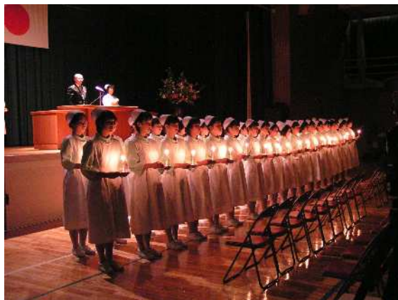
< 戴帽式 >