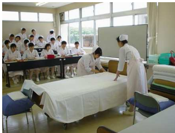
< 校内実習 >

看護師を目指す5年一貫教育を行う公立高校は、県内では桃陵高等学校、宝陵高等学校の2校です。