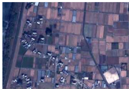
リモートセンシングによる地力把握（上空よりのほ場写真）