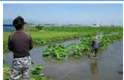
ぬかるむ水田での防除