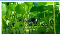
移動も困難なほど茎葉が繁茂するほ場