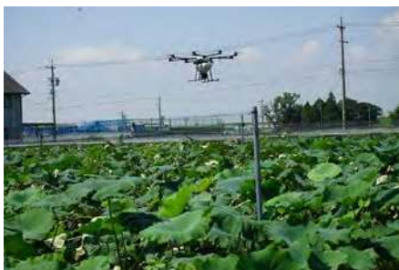
農薬散布用ドローンの検証