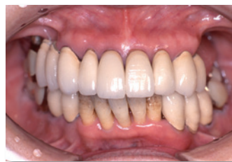
進行した歯周病患者の口腔 (68歳 女性)

歯周病は自覚症状が乏しく、 自分で気づきにくい病気です。 歯肉からの出血や腫れ、 痛みなどがあたらすぐ受診を!