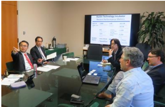
大村知事によるテキサス大学オースティン校訪問（2018年5月9日）