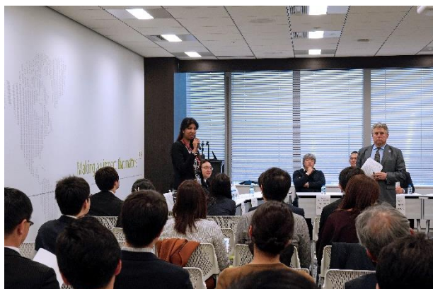
第1期プログラムキックオフセミナー (2019年3月2日)

ワークショップを通じて、愛知県のスタートアップ・エコシステム構築を担う支援機関の育成を実施。