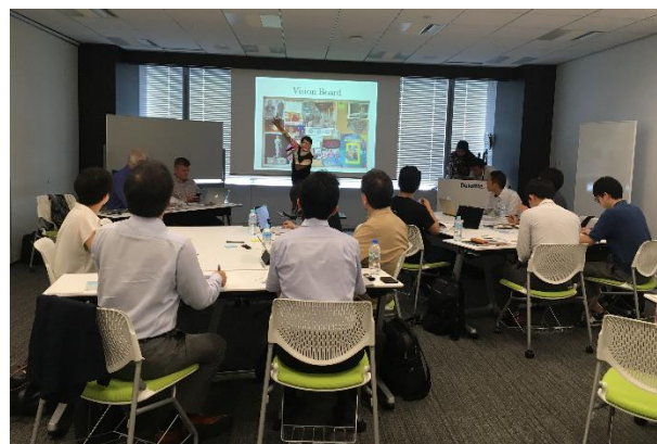
第1期スタートアップ北米展開支援 プログラムピッチコンテスト (2019年8月7日～8月9日)