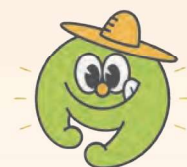
いいともあいち運動シンボルマーク「あいまる」

いいともあいち運動では、以下の取組により、愛知県の農林水産業の応援団になっていただける方々を随時、募集しています。