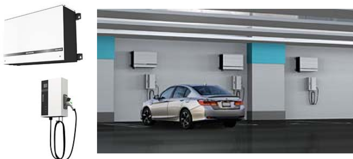
表 6-1 充電器 (HEH55) の主要緒元