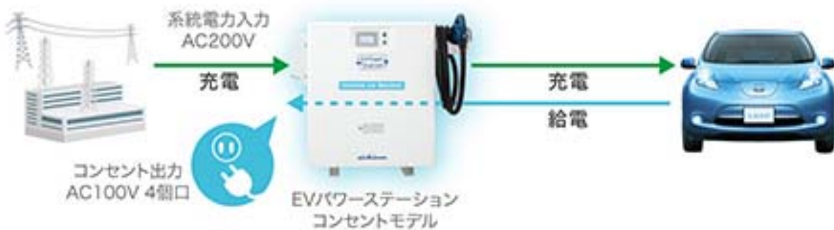
図 6-9 非常時・通常時のシステム活用イメージ