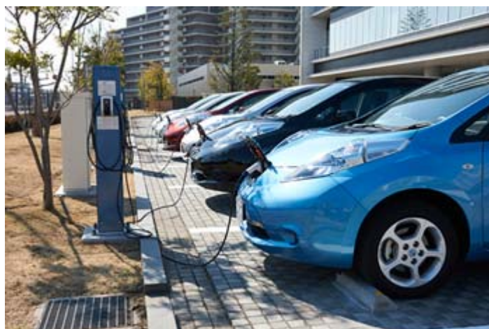
図 6-10 ワークスペースチャージングを行っている国内事例

http://www.nissan-global.com/JP/NEWS/2014/_STORY/140806-02-j.html