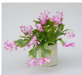
シャコバサボテン