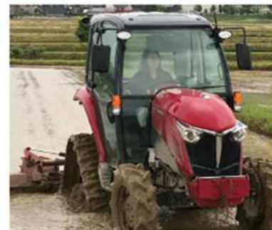
新潟県 (株)花の米 女性にも操作しやすい57馬力のトラクター