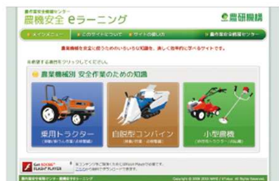
農研機構 HP 「農機安全 e ラーニング」

http://www.naro.affrc.go.jp/org/braint/anzenweb/