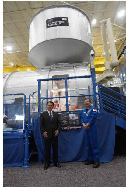
「きぼう」のモックアップの前で