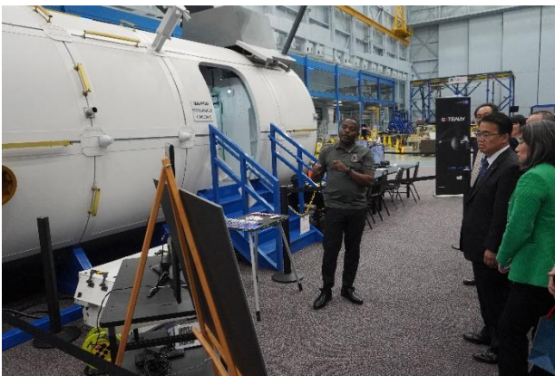
アルテミス計画の説明を受ける様子