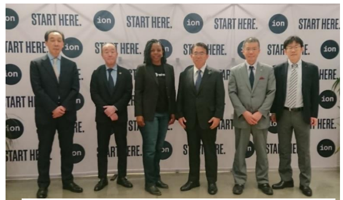
ルフロア戦略連携担当上級ディレクター（左から3人目）との記念撮影