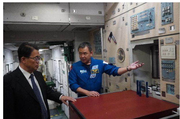
ISS の船内の説明を受ける様子