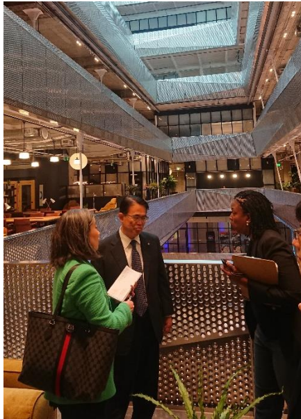
施設の構造について説明を受ける様子