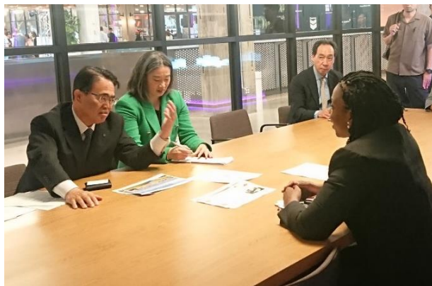
ルフロア戦略連携担当上級ディレクターとの面談の様子