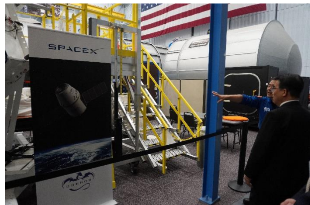
SpaceX の説明を受ける様子