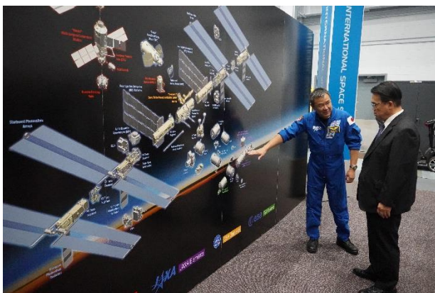
ISS 全体の説明を受ける様子