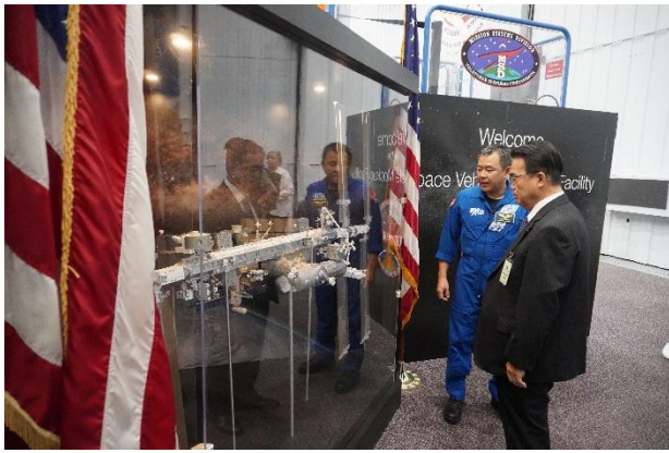
星出宇宙飛行士から ISS 全体の説明を受ける様子