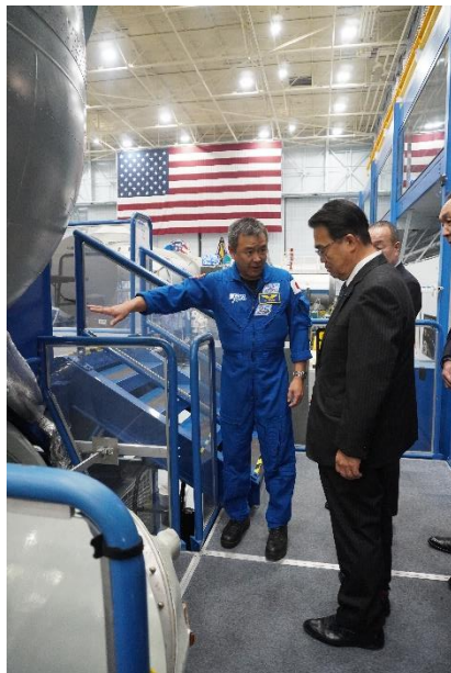
ソユーズの説明を受ける様子