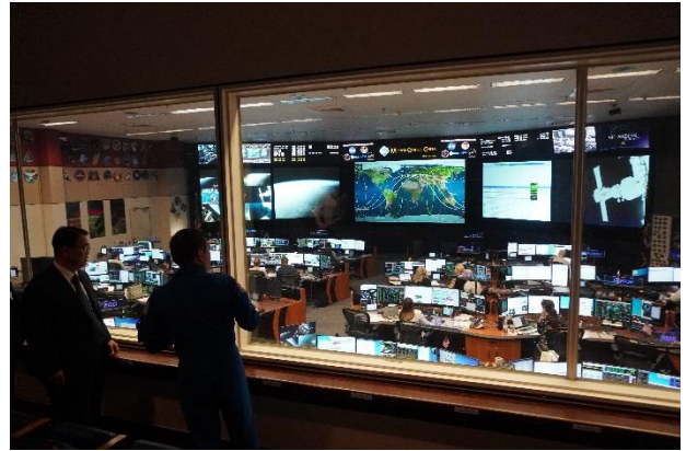
管制センターの視察の様子