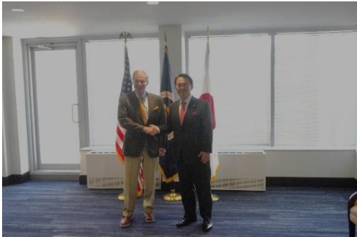
ネルソン長官との記念撮影