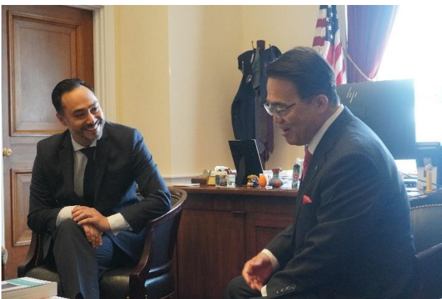
カストロ議員との面談の様子

また、知事が、「日米関係は世界で最も重要な二国間関係である。」と述べたところ、カストロ議員から「全く同意見である。だからこそ私も米日議員連盟に入っている。」との発言があり、両者とも今後も日米関係のために貢献をしていく意志を述べました。