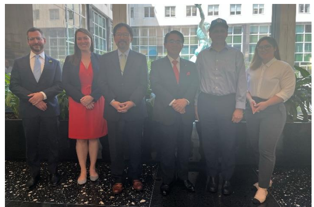
国務省の皆さんとの記念撮影