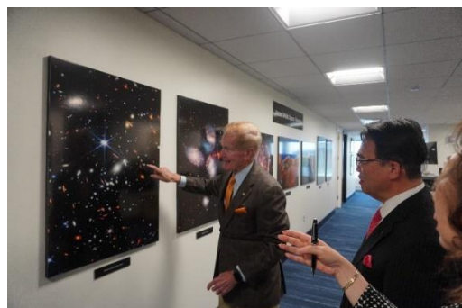
ジェイムズ・ウェッブ宇宙望遠鏡が捉えた 350億年前の光について説明を受ける様子 135