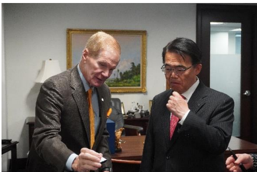
模型により宇宙開発計画の説明を受ける様子