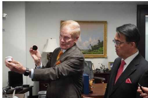
模型により宇宙開発計画の説明を受ける様子