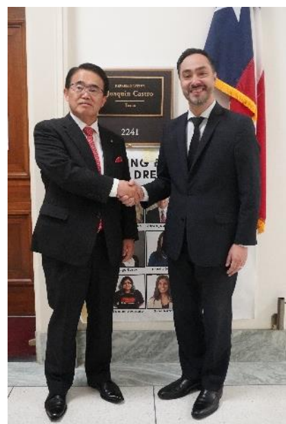
カストロ議員との記念撮影