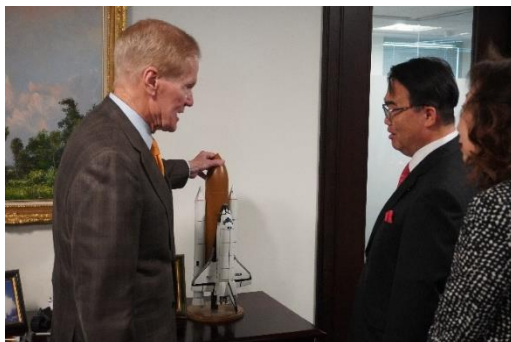
ネルソン長官がかつて搭乗した 宇宙船について紹介を受ける様子