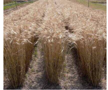
小麦新品种「きぬあかり」