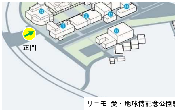
リニモ 愛・地球博記念公園駅