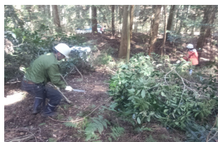
除伐作業等の森林保全活動