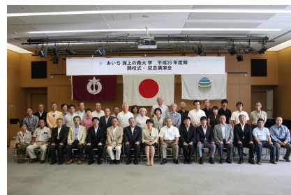
開校式記念撮影(7月12日)