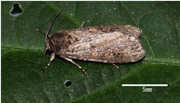
図 2 成虫