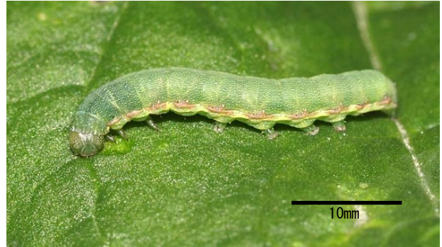
図 3 老齢幼虫