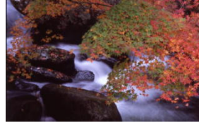
保殿の七滝の紅葉