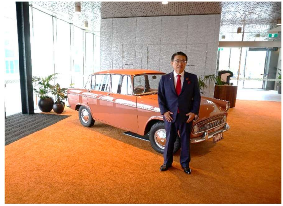
会場内で展示された トヨタ社製「ティアラ」前で記念撮影