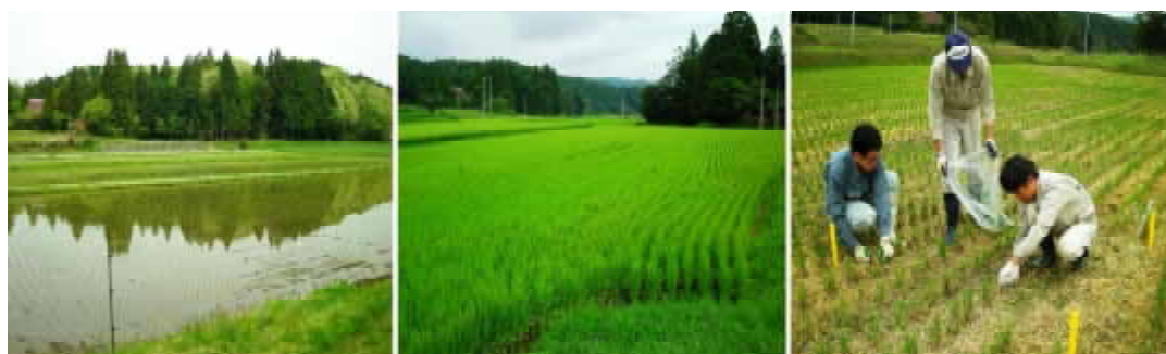
写真1 調査ほ場の様子（作手地区、左：移植直後、中央：出穂時期、 右：坪刈りによるヒコバエ発生量の調査）