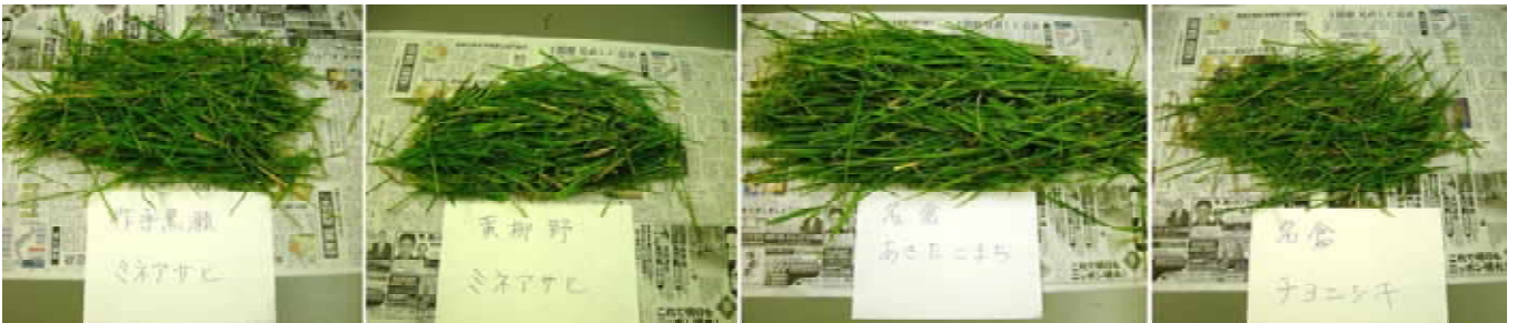
写真2 坪刈りしたヒコバエ（左から作手地区、鳳来地区、名倉地区①、名倉地区②）

同じ品種を栽培した作手地区と鳳来地区を比較したところ（写真2）、収穫後の経過日数が5日短い鳳来地区（標高228m）において、作手地区（標高516m）とほぼ同等の推定発生量であった（第1図）。名倉地区①、②は隣接しているが、①では早生品種「あきたこまち」が栽培され、収穫後の経過日数の違い（10日間）により推定発生量に約8.4倍の差が生じた（第1図）。