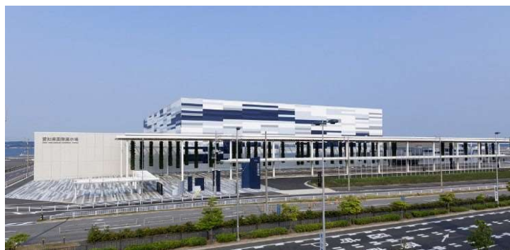
Aichi Sky Expo

愛知県は、製造業を中心とした世界有数の産業集積があり、国際空港や高規格道路網等の充実した交通インフラを有しています。Aichi Sky Expo は、こうした愛知県の特性を活かし、展示会等を通じた多様な交流の促進による新産業の創出や既存産業の強化を図っています。また、国内外からの集客による産業首都愛知の新たな交流・イノベーション拠点の創造に寄与しています。