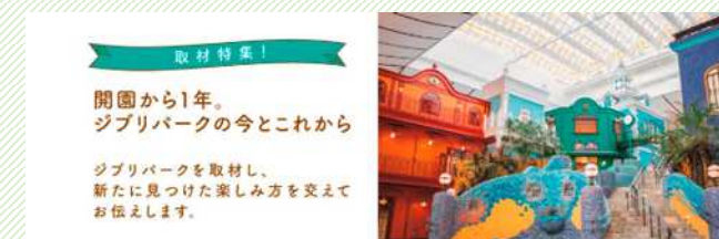
(一社)長久手市観光交流協会 HP

(一社)長久手市観光交流協会のHPにてジブリパーク特集ページを掲載し、観光客に向けたPRを行った。