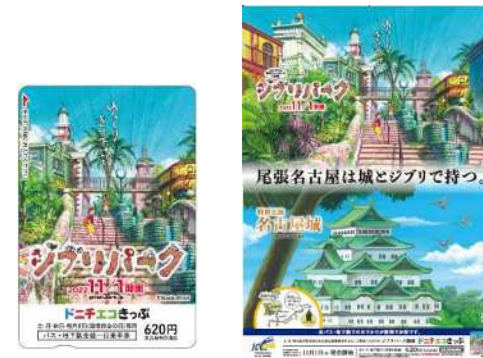
参考 令和4年度発売 記念乗車券