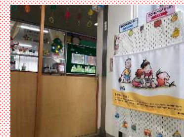
子育て関連施設に タペストリーを掲出