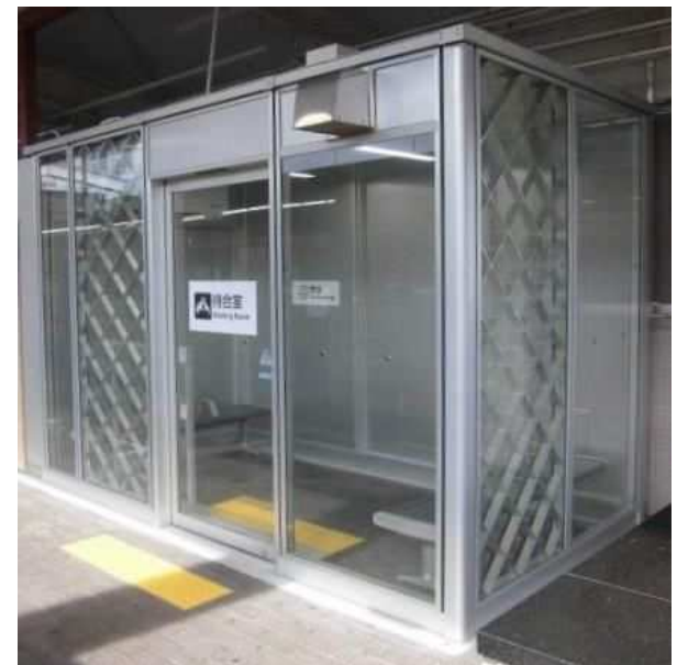
地下鉄藤が丘駅ホームに冷房付き待合室を整備（供用開始：令和5年6月30日）