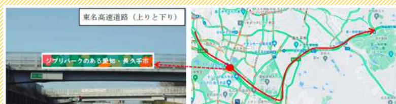
設置イメージ及び場所