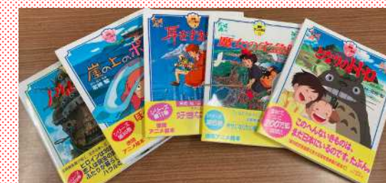
配布したアニメ絵本

子どもたちにジブリ作品への興味・関心を深めてもらうため、アニメ絵本を小学校(6校×10冊)や保育園(6園×3冊)、児童館等の児童関連施設(26施設×5冊)に配布した。