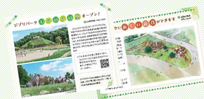
市広報特集記事 (R5.8月、11月号)

「広報ながくて」にてジブリパーク特集記事(もののけの里・猫の城遊具等の紹介)を掲載。市民に対しPRを行った。