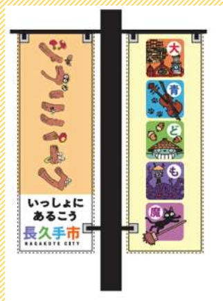
バナーデザイン (案)