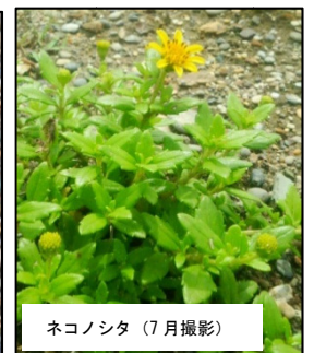
ネコノシタ (7月撮影)