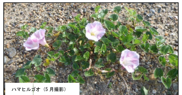
ハマヒルガオ (5月撮影)