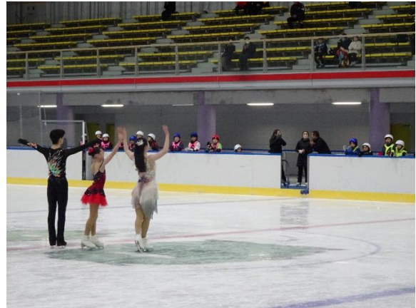
演技をした選手へみんなで拍手