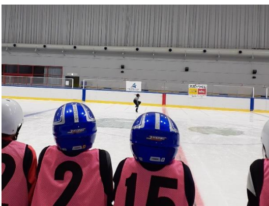
模範演技を見つめるアカデミー生