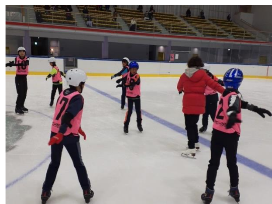
スピンなどの応用技にも挑戦