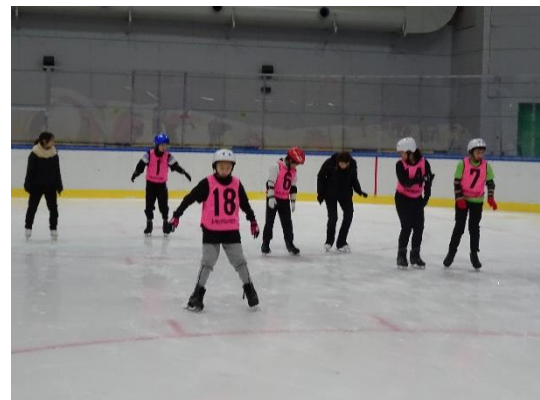
氷上での滑走体験の様子②