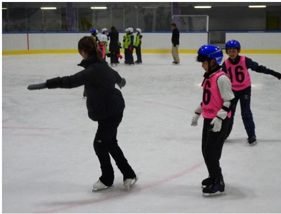
円を描くように滑ります

後半は、スピンや軽くジャンプすることにも挑戦し、2回の競技体験でスケートの楽しさを体験することができました。