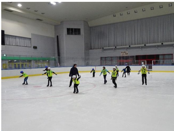
ジャンプにも挑戦