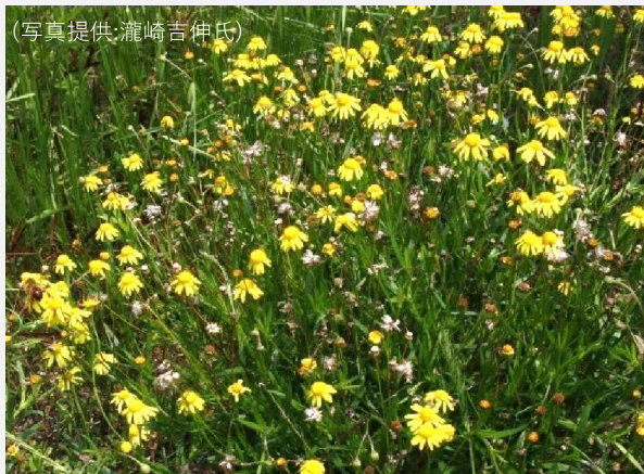
埋立地で繁茂するナルトサワギク