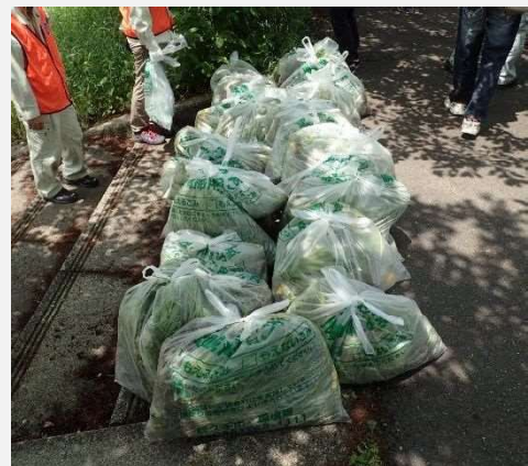
除去した植物体の袋詰め