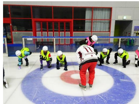
転んだ後の立ち上がり方を確認