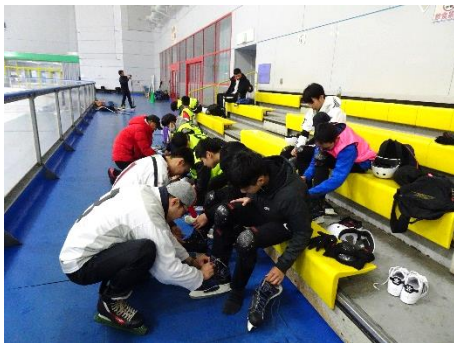
スケート靴の履き方の確認

開始から1時間後、スティックを使った練習を行いました。4人組でスティックを立て、倒さないよう左右に移動してスティックをキャッチする練習では、全員が成功すると歓声が上がっていました。パックコントロールでは、最初は思うようにパックをコントロールできませんでしたが、時間が経つにつれ、ドリブルやパス、シュートが上手にできるようになりました。