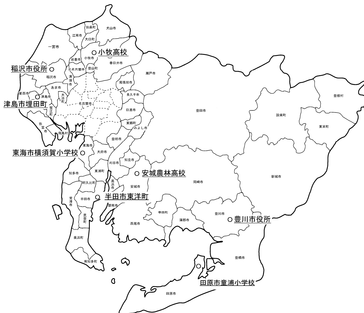
図 4-5-1 アスベスト大気環境調査地点位置図