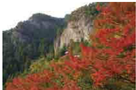
鳳来寺山／天竜奥三河国定公園（新城市）