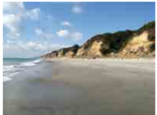
渥美半島海食崖／三河湾国定公園（田原市）