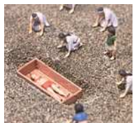
方形周溝墓のイメージ