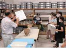
バックヤードの解説の様子

「史跡貝殻山貝塚交流館」の展示品と、普段は公開していないバックヤードの収蔵品を学芸員の解説付きで御案内します。