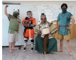
弥生こども紙芝居