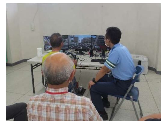
運転シミュレータ