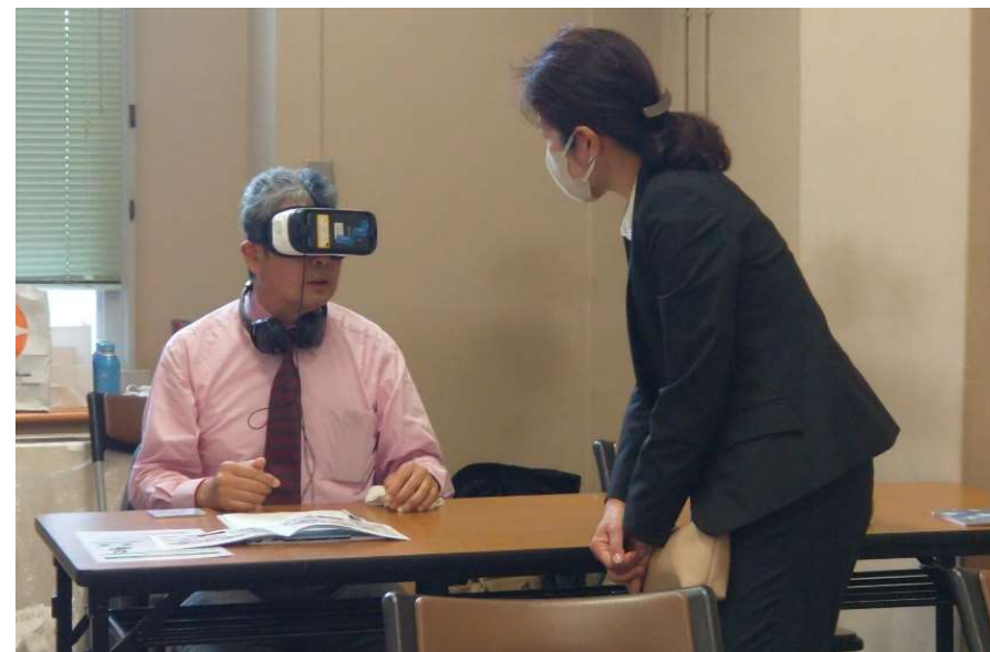
VRゴーグルを装着し体験する様子