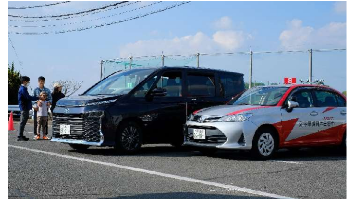
「アドバンスパーク」