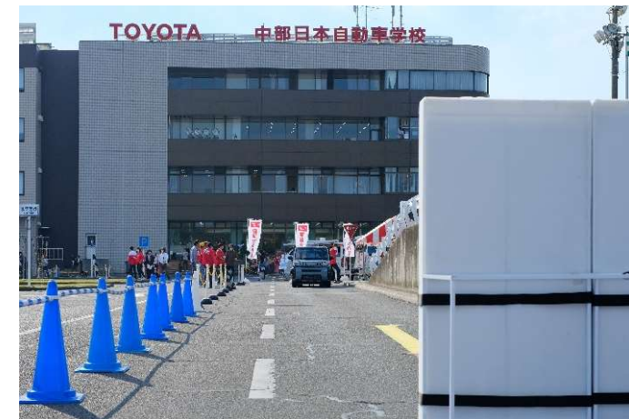
ダイハツ予防安全機能「スマートアシスト」