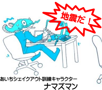
あいちシェイクアウト訓練キャラクター ナマズマン