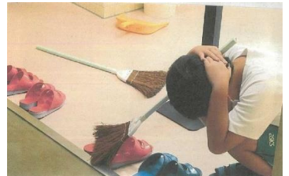
↑岡崎市立下山小学校でのシェイクアウトの様子 (2022年)