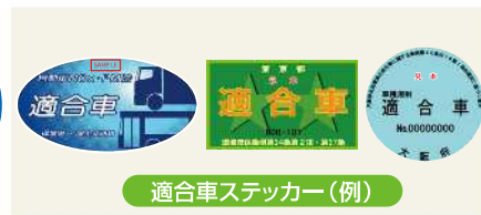
適合車ステッカー（例）