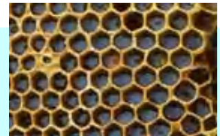
巣に貯められたハチミツ

働きバチの活動エネルギー源はハチミツです。 ハチミツが無くなると活動が鈍り、死亡してしまいます。