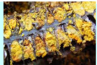
貯蔵花粉(花粉パン)

働きバチの幼虫のエサは、最初の3日間はローヤルゼリー、その後はハチミツと花粉を混ぜたエサです。 巣にはハチミツだけではなく、花粉も貯蔵します。 ローヤルゼリーは働きバチが花粉を食べて分泌します。