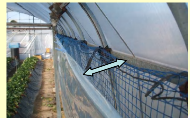
二重カーテンの隙間を無くす