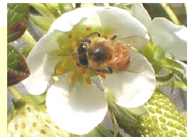
幼虫が育つには花が必要

花蜜や花粉を補給するためにも良い花がいつもたくさん咲いている状態を保つようにしましょう。