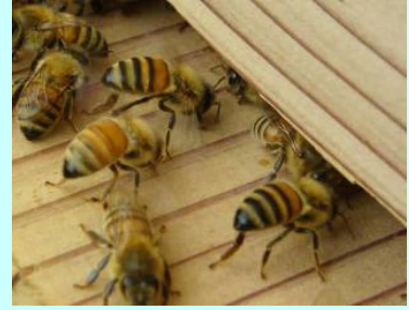
扇風：巣を冷やすために行う