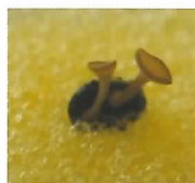
キノコ(子のう盤)の 発生した菌核 (子のう盤上に胞子を 形成し飛散する)