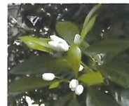
N A A 散布区での 着花状況

夏枝からの夏秋梢の伸長抑制を目的として、1-ナフトレン酢酸ナトリウム水溶剤（N A A）とエチクロゼート乳剤を散布したところ、加温後の着花量は同等ですが、N A A散布ではデンプン蓄積が多く、充実した結果母枝とすることが分かりました。 （園芸研究部）