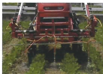
乗用管理機による 畦間・株間散布

その結果、ホオズキ類に対し除草効果が高く有効な除草法であることが分かりました。 （作物研究部）