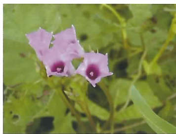
ホシアサガオの花

近年、愛知県のダイズほ場で帰化アサガオ類が発生し、防除が難しいため大問題となっています。従来から4種の帰化アサガオ類の発生が確認されてきましたが、2004~2008年に行った定点調査で「ホシアサガオ( Ipomoea triloba L.)」の発生地点数が増加していることを確認しました。この調査から「ホシアサガオ」が優占種となる可能性が明らかとなったため、本種の生態を重点的に解明し、除草技術の開発を進めます。(作物研究部)