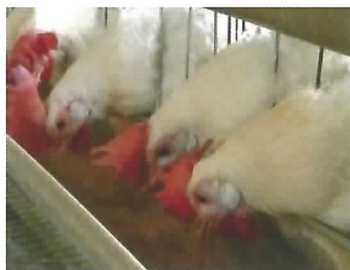
飽食しても休産している鶏

加齢により低下する産卵量と卵の品質を回復するため、これまで、低エネルギーの餌(ふすま)を与えて休産させる方法が用いられてきました。しかし、この方法では給餌量を制限する必要があるため、鶏に満腹感を与えることができずストレスとなっていました。そこで、ふすまにあわ殻を混ぜ、餌をさらに低エネルギーに改良することにより、鶏に飽食させ満腹感を与えながら休産させることが可能となりました。(畜産研究部)