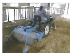
試験の様子(攪拌作業)

この技術による臭気発生低減効果を明らかにするとともに牛の行動等に及ぼす影響を観察し、有効性を検証します。(畜産研究部)