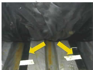
栽培槽に設置した培地加温用発熱体

バラは冬季18℃程度の高温で栽培するため、原油価格高騰の影響を強く受けています。そこで、後夜半の暖房温度を下げ(12℃)、培地加温(21℃)を行う方法で、収量品質を落とさず節油が可能になることを明らかにしました。今後、ヒートポンプも併せ一層の燃油削減を検討します。(園芸研究部)