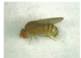
オナジショウジョウバエ