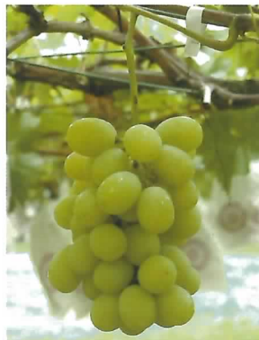
種なし栽培のシャインマスカット