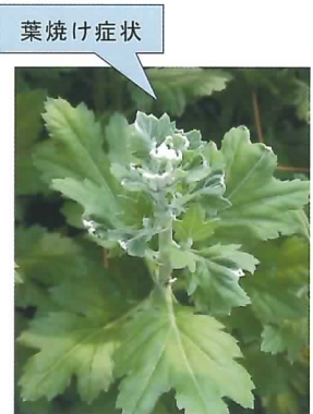
葉焼け症状の発生状況

生殖成長期における送風の有無が葉焼け症状発生率に及ぼす影響(9月開花での試験結果)