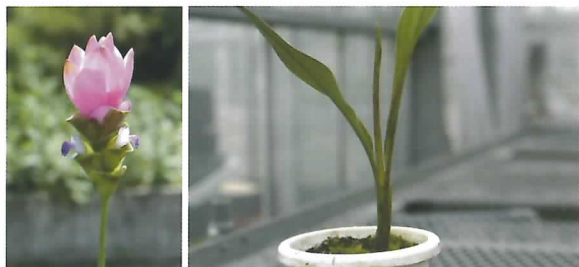
左：クルクマ「シャローム」の花 右：クルクマさび斑病の発生状況