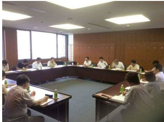
連携推進部会(理事会室)