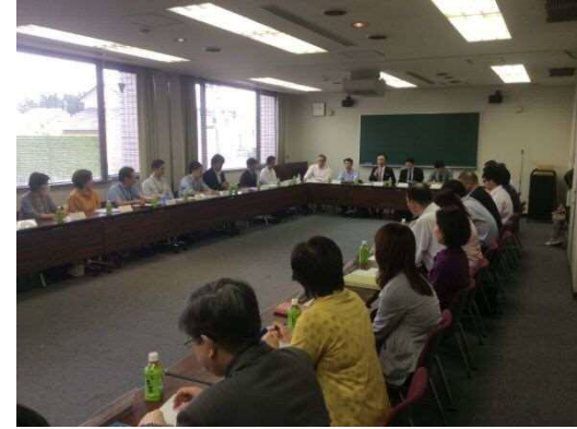
瀬戸旭在宅医療介護連携推進協議会実行委員会(3階会議室)