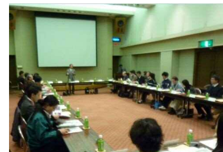
在宅医療介護連携推進協議会