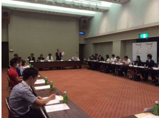
瀬戸旭在宅医療介護連携推進協議会(1階ホール)