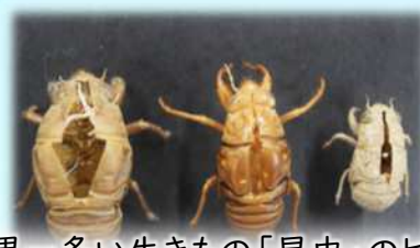
世界一多い生きもの「昆虫」のヒミツ ~残された手掛かりから正体をあばけ!~