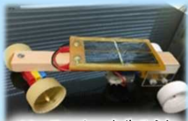
ソーラーカーを作ろう! <"発電"もいろいろ>