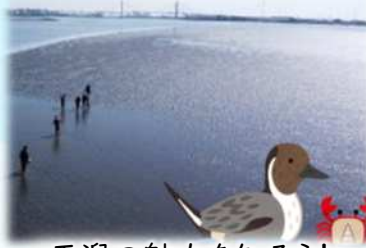
干潟の魅力を知ろう!