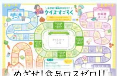
めざせ!食品ロスゼロ!! クイズすごろくで遊ぼう