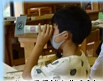
森の万華鏡を作ろう!