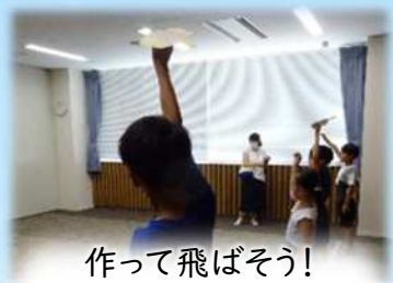
作って飛ばそう! むささびグライダー