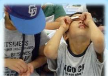
カード型顕微鏡を作ろう!