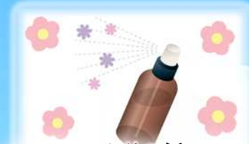
かおりの話 ~ルームスプレーを作ろう~