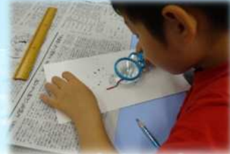
ほんとはスゴイ!ミミズのヒミツ