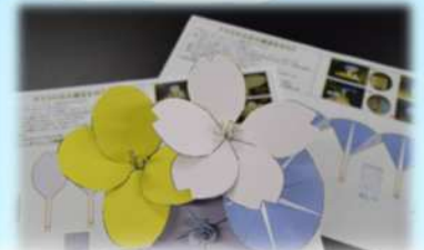
花のつくりってどうなっているの? 花の模型を作ってみよう!