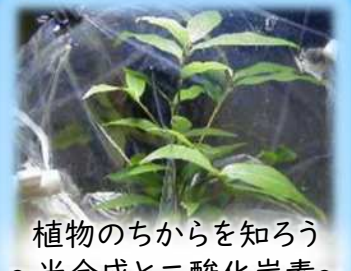
植物のちからを知ろう ~光合成と二酸化炭素~