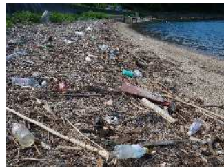
海岸に漂着したプラスチックごみ