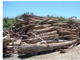
大雨後に港に積み上げられた流木

流域圏での海洋ごみ対策の推進により、伊勢湾の良好な景観や海洋環境の保全を図ることを目的に、岐阜県・愛知県・三重県が共同で本計画を策定