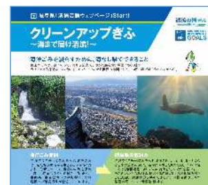
岐阜県 清掃活動ウェブページ