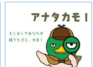
三重県 普及啓発動画