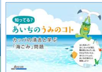
愛知県 環境学習プログラム