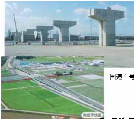
国道1号立体交差部