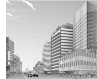
[商業施設・オフィスビル等の木造・木質化]