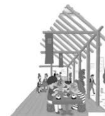
県産木材利用への支援 【事業推進】