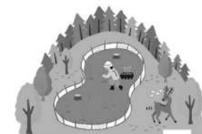
花粉の少ない苗木の植栽