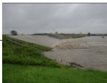
激待事業後初めて越水する洗堰(名古屋市北区) 【平成23年9月台風15号時】