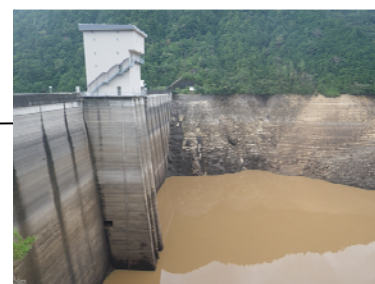
宇連ダムの濁水状況(新城市) 【平成25年9月 貯水率0.8%】