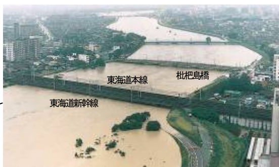
JR東海道新幹線庄内川橋りょう付近 【平成12年東海豪雨時】(名古屋市西区・清須市)