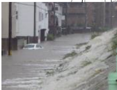
八田川の浸水状況(春日井市) 【平成23年9月台風15号時】