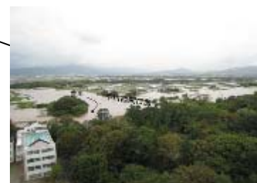
豊川の浸水状況(豊橋市) 【平成23年9月台風15号時】