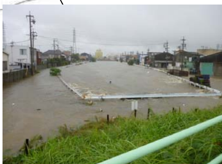
地蔵川の浸水状況(春日井市) 【平成23年9月台風15号時】