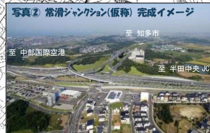
写真② 常滑ジャンクション（仮称）完成イメージ

※交通規制の期間等はあくまで予定となります。 詳しい情報は、現地の看板等でお知らせします。