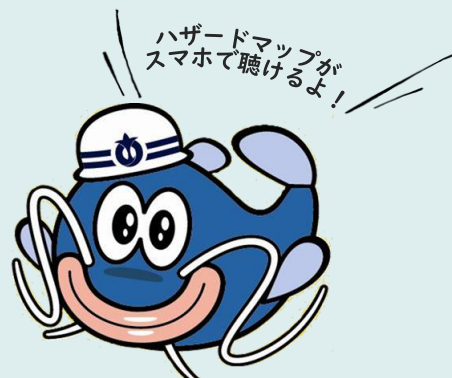
あいち防災キャラクター 「防災ナマズン」

視覚に障がいのある方や小さな文字が見えにくいご高齢の方、日本語に不慣れな外国の方などが平時から水害のリスク等を認識し、早めの避難につなげていただけるよう、スマホで聴ける 耳で聴くハザードマップ を導入しました。